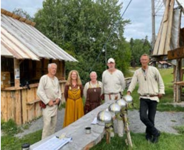
Bilder fra besøket av Sundvollen Oppvekstsenter: