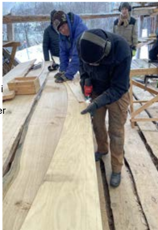
Lager mal i finer som tegnes over på emnet.