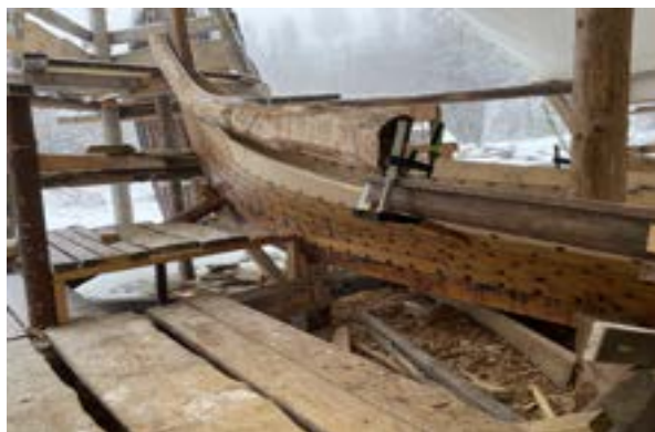
Nå skal den tilpasses