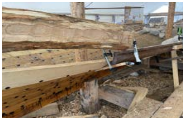
Ende av Meginhufr ser slik ut.

Verktøy: øks av forskjellig slag, skjøve ( se omtale av hugging / høvling av bette / bjelkelag for dørken) og høvel.