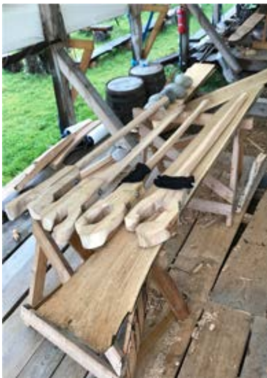
Stor redskap må til. Se hanskene mine som ligger der, streverene er ca 2 meter lange.

Skal han holde og bære må han vite detaljer for det, og skal han betjene redskaper må han vite hvor og når han skal trå til. Noen tørre forsøk.