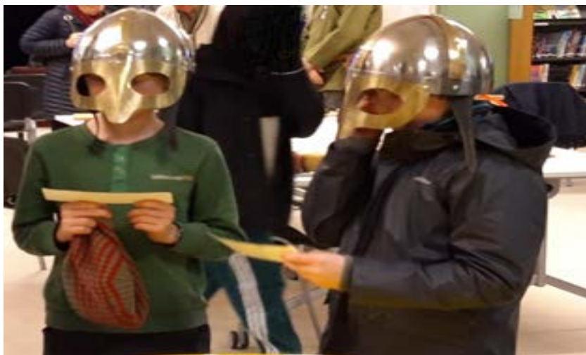
Barna leser opp litt info om kongene.