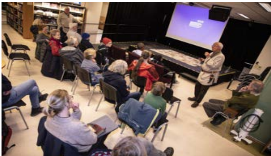
Et lydhørt publikum i alle aldre.