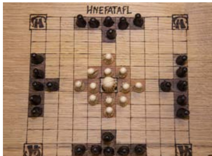
Vi hadde med oss vikingspillet «Hnefatafl»