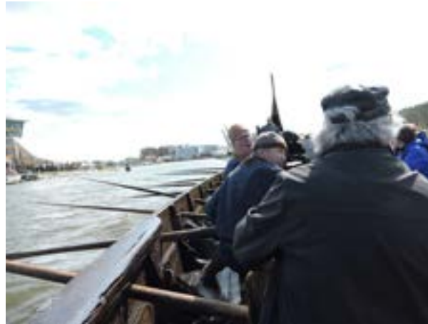
Saga Farmann på vei til Miklagard (Istanbul)